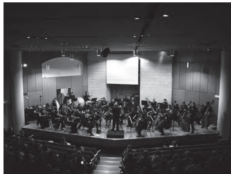
A.A. 2017/2018 - Orchestra Sinfonica del Conservatorio