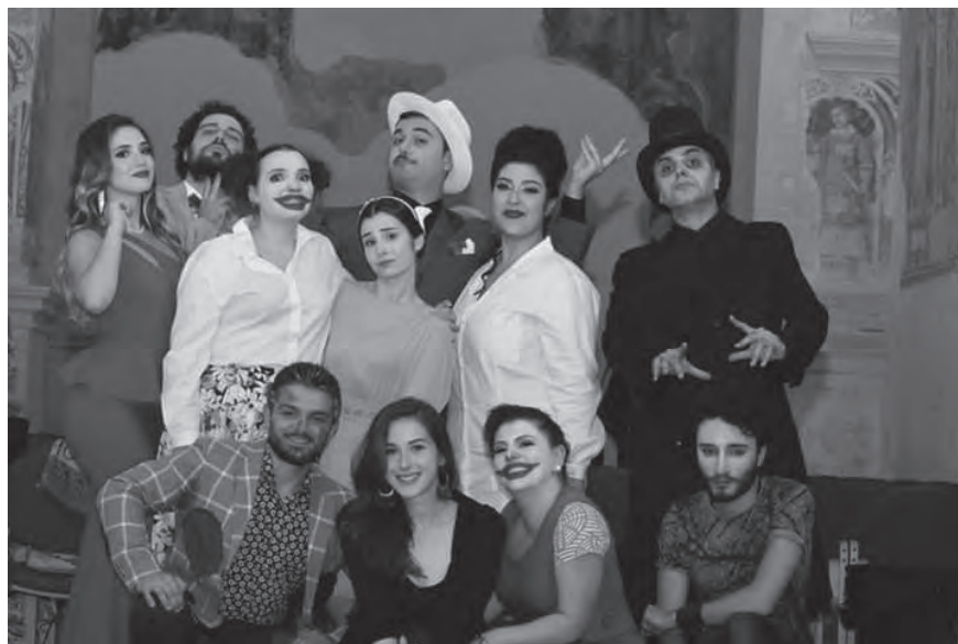
Giugno 2018 - "L'Isola dei Pazzi" di Egidio Romualdo Duni - Corte dell'ex Ospedale San Rocco