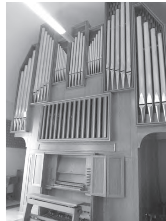
Organo Ponziano Bevilacqua op. 64