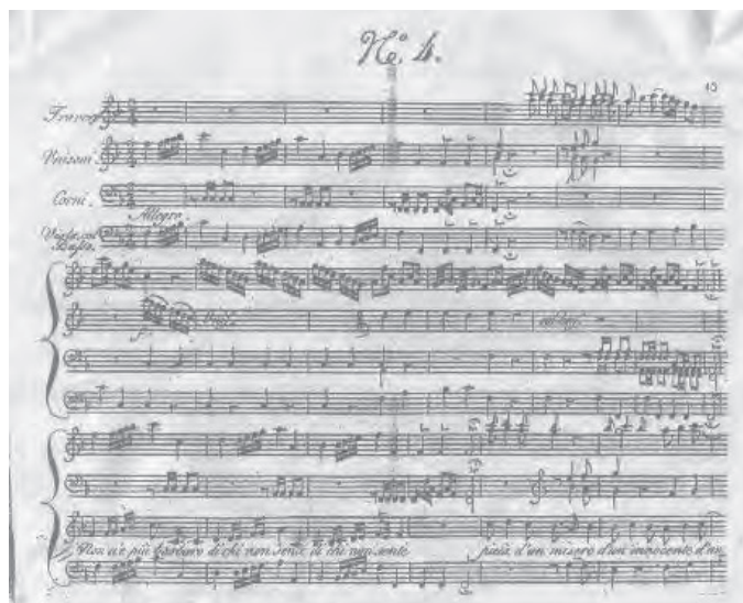
Manoscritto dell'aria "Non v'è più barbaro" da Arie per Farinelli di E. R. Duni