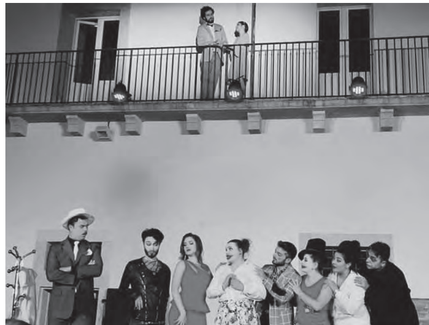
Giugno 2018 - "L'Isola dei Pazzi" di Egidio Romualdo Duni - Corte dell'ex Ospedale San Rocco