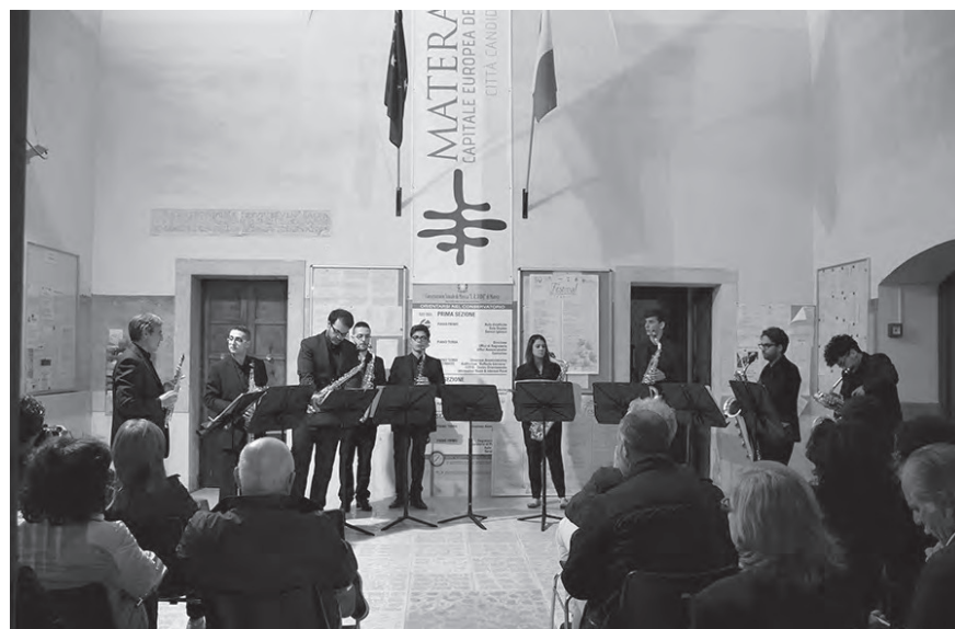
Saextuor diretto dal prof. V. Soranno - Atrio del Conservatorio