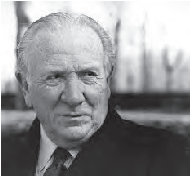
Raffaele GERVASIO (Bari, 26 luglio 1910 - Roma, 4 luglio 1994)