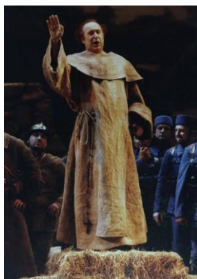
"La forza del destino"