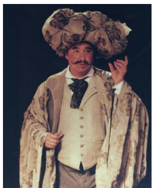
"L'Italiana in Algeri" Taddeo Teatro Comunale - Bologna