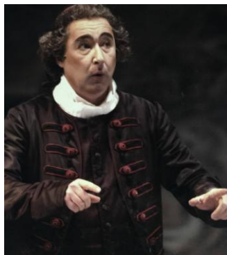
"Il Barbiere di Siviglia" Don Bartolo Teatro Regio - Torino