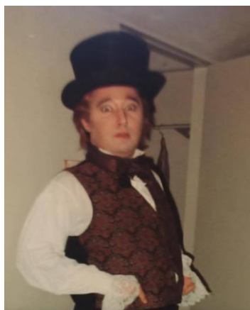
"Così fan tutte" Don Alfonso Coven Garden - Londra